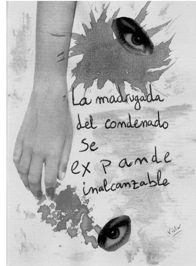
Insomnio nº. 1